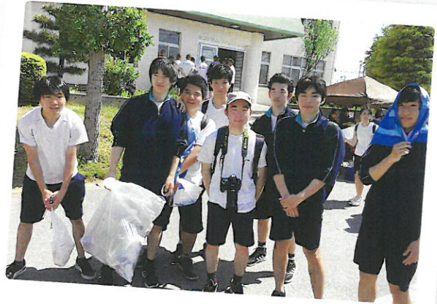
歩け歩け大会(5月24日)