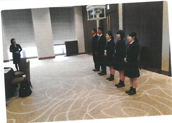
仙台ホテル研修(6月11日)