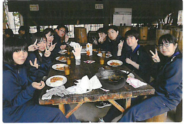
花山オリエンテーション合宿(4月18日~19日)